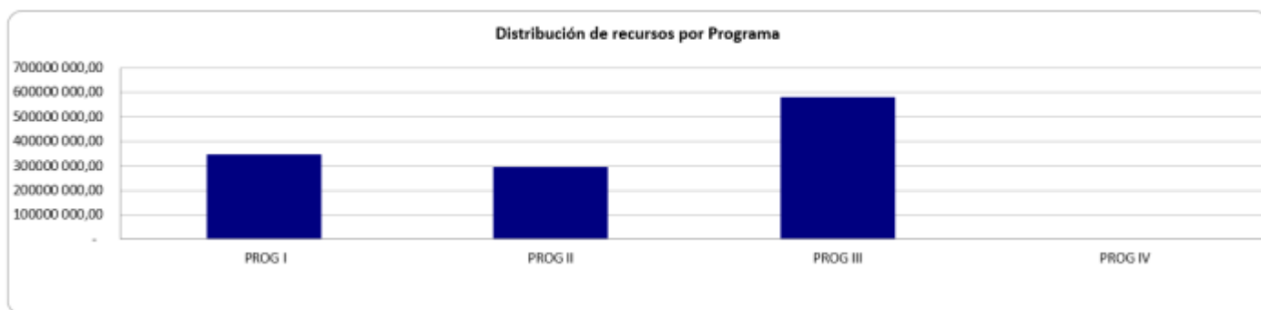
Distribución de recursos por área estratégica del Plan de Desarrollo Municipal