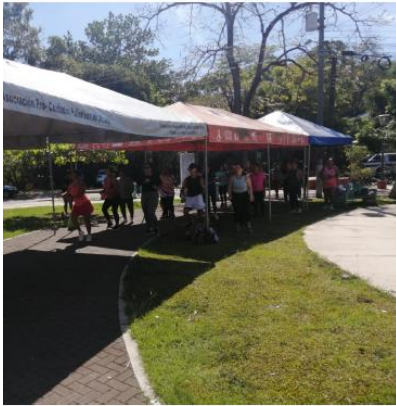
Día de la Mujer 8 marzo