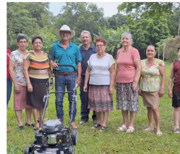
ADI LA TIGRA