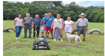
ADI EL MANGO