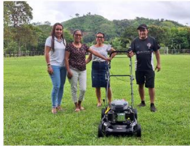
ADI LA FRESCA