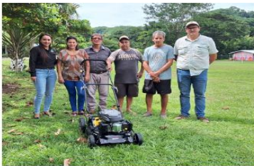
ADI PILAS DE CANGEL

Donación de Chapeadoras de 4 ruedas a las ADI