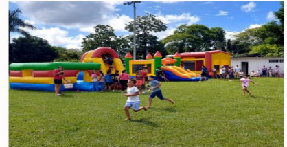
Asistencia a la actividad 270 niños