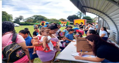
Día del Niño(a)