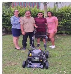
ASOCIACION DEPORTIVA DE FUTBOL FEMENINO PENINSULAR