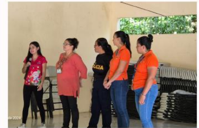
Actividades de la Mujer