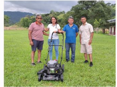
ADI SAN MIGUEL DE RIO BLANCO