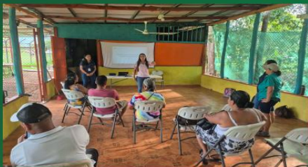
Se realizan talleres en las comunidades de Residuos Valorizables

PLAN MUNICIPAL DE GESTIÓN INTEGRAL DE RESIDUOS SÓLIDOS DEL CONCEJO MUNICIPAL DE DISTRITO DE LEPANTO 2025-2030