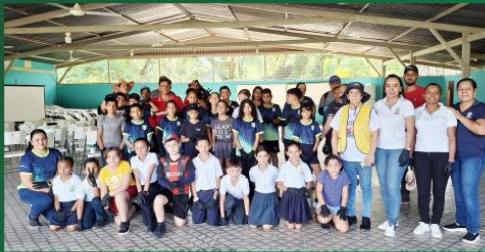
Limpieza en comunidades con la UNED, ADI de Corozal, Jicaral y San Blas