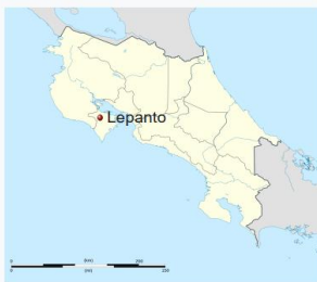
Localización de Lepanto en Costa Rica

Coordenadas: 9°53'16.98" N, 85°7'58.97" W