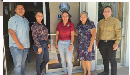
Cooperación con la Dirección General de Educación Vial - MOPT, para la obtención de Licencias de Conducir