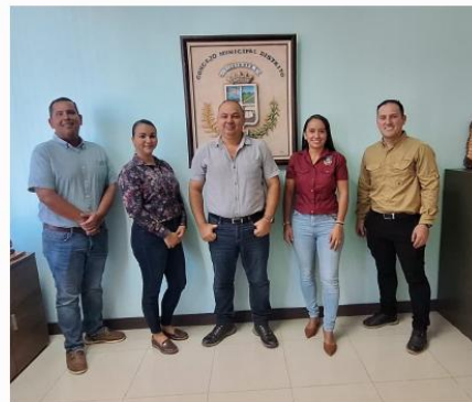
405 inscripciones – Prueba teórica.