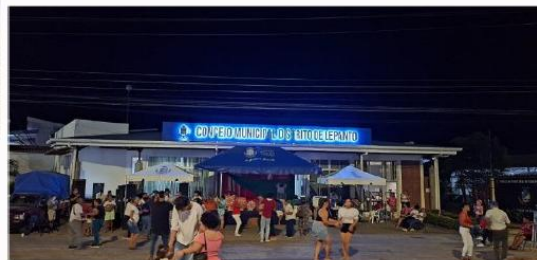
25 Julio Anexión del Partido de Nicoya