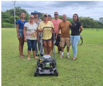
ADI ISLA VENADO

Donación de Chapeadoras de 4 ruedas a las ADI